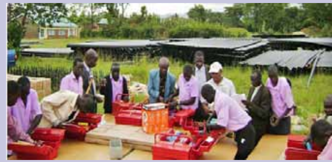
Chuo-Anuwai kimepewa zana za kufanyia biashara

wa Miradi hii itabakia kuwa ile ya Waziri Mkuu, Wizara ya Maswala ya Vijana, na Wizara nyingine husika, huku KEPISA ikiwa ndio mshirikishi mkuu wa uhusika wa mashirika ya kibinafsi. Serikali pia imeboresha Hazina ya Maendeleo ya Vijana kwa kuwatengea shilingi milioni 550 na Hazina ya Maendeleo ya Wanawake kutengewa shilingi milioni 400 ili kuendelea kutoa mtaji wa kutosha kwa vijana na wanawake kwa lengo la kuwawezesha kuanzisha biashara na mipango yao ya uwekezaji.