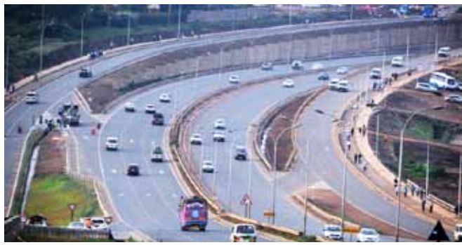
Barabara Mpya ya Thika Super highway, sehemu ya Ruaraka-Roasters