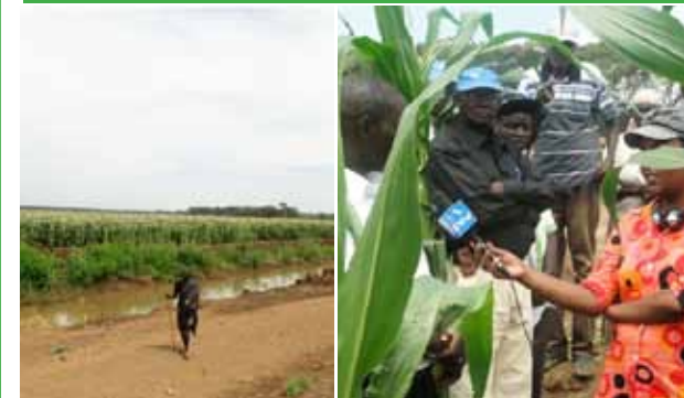
Mahindi yaliyokomaa katika mradi wa Katilu Irrigation Scheme— Picha NIB Picha iliyopigwa Novemba 2011. Na NIB

Mgao huo wa shilingi bilioni 8 kwa sekta ya kilimo utahakikisha uendeleu na kudumu kwa miradi hii ya unyunyiziaji mashamba maji na hali kadhalika kuanzisha miradi mingine mipya katika maeneo yote nchini. Ili kushughulikia la kutopatikana Kilimokutopatikana kwa mikopo, Hazina ya Kilimo--Biashara imeongezwa kitita cha shilingi bilioni 1 katika bajeti ya 2012/13. Maagano haya pamoja na mikataba na benki za kuwekeza shilingi 10 kwa kila shilingi ya serikali ikiwekezwa ili kujikinga na mazingira ya athari. Uwekezaji huu utafanya usawa Kilimousawa wa kimapato katika benki za kibashara kwa lengo la kuwekeza katika Hazina ya Kilimo--Biashara hadi shilingi bilioni 10. Uwekezaji huu unatazamiwa kuimarisha Kilimo na kukifanya kuwa biashara nzuri na kuwavutia wawekezaji wa kibinafsi na vijana.