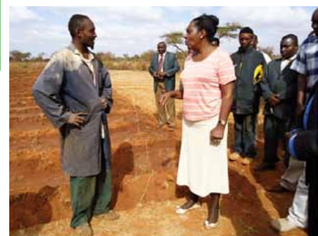
Mhe. Charity Ngilu, Waziri wa Maji na Unyunyiziaji, akimhoji mkulima wa unyunyiziaji mimea maji huko Birikani, Kajiado, 31 Januari, 2012

Mgao huo wa shilingi bilioni 8 kwa sekta ya kilimo utahakikisha uendeleu na kudumu kwa miradi hii ya unyunyiziaji mashamba maji na hali kadhalika kuanzisha miradi mingine mipya katika maeneo yote nchini. Ili kushughulikia la kutopatikana Kilimokutopatikana kwa mikopo, Hazina ya Kilimo--Biashara imeongezwa kitita cha shilingi bilioni 1 katika bajeti ya 2012/13. Maagano haya pamoja na mikataba na benki za kuwekeza shilingi 10 kwa kila shilingi ya serikali ikiwekezwa ili kujikinga na mazingira ya athari. Uwekezaji huu utafanya usawa Kilimousawa wa kimapato katika benki za kibashara kwa lengo la kuwekeza katika Hazina ya Kilimo--Biashara hadi shilingi bilioni 10. Uwekezaji huu unatazamiwa kuimarisha Kilimo na kukifanya kuwa biashara nzuri na kuwavutia wawekezaji wa kibinafsi na vijana.