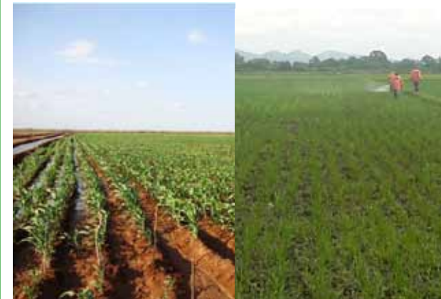
Bura (ekari 7,000 za mahindi) - Januari 2012